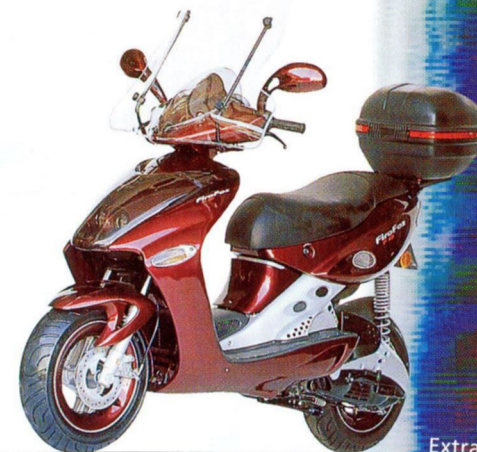
Extra-Zubehör: Windschild, Topcase, Gepäckträger