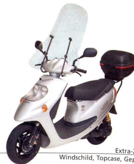
Extra-Zubehör: Windschild, Topcase, Gepäckträger